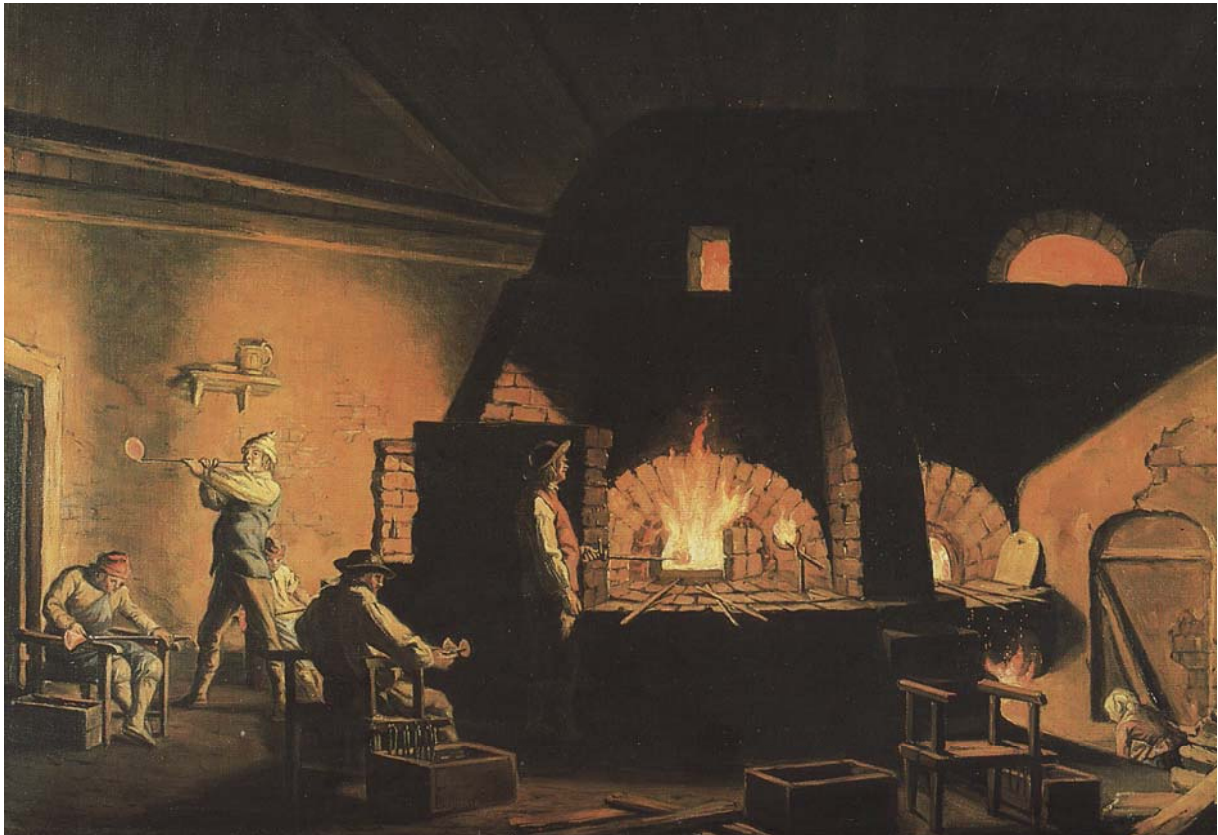
Pehr Hilleström, Kungsholms glasbruk, något beskuren, Smålands museum.