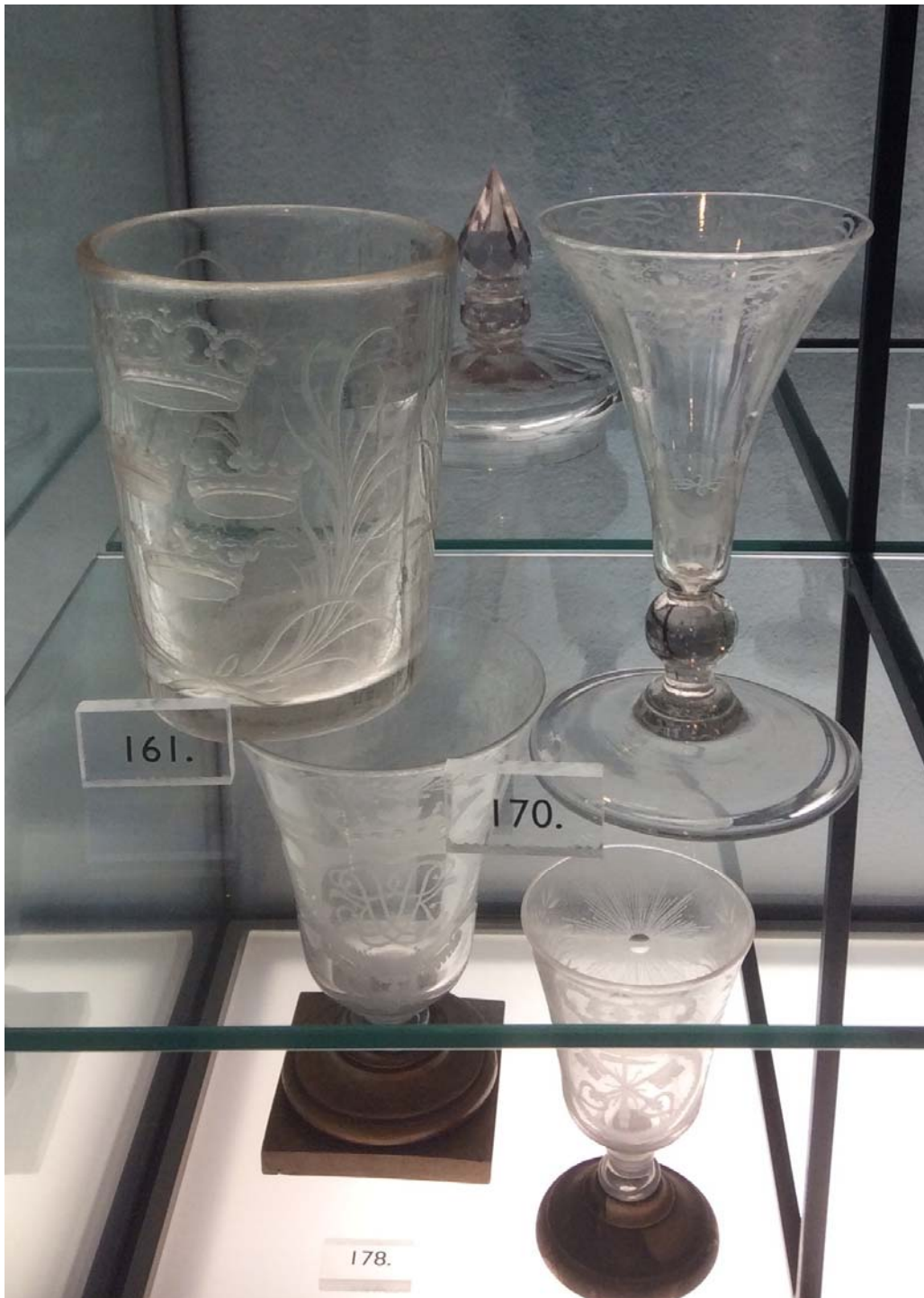
Några graverade bägare från Kungsholms glasbruk i en monter på Kulturen i Lund. MP 2021. De halvgenomskinliga bägarna på nedre hyllan är påverkade av glassjuka.

glassmältan blandar i för mycket alkalioxider och därefter utsätter de färdiga föremålen för alltför mycket fukt och luftens påverkan i form av koldioxid. Handdisk och noggrann torkning med handduk är att rekommendera, liksom att inte låta proppen sitta kvar i karafferna eller att ställa sina glas upp och ned i skåpen. I blomvaser av glas bör man också byta vatten ofta. 6